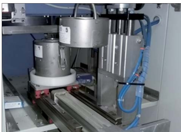
Figura 5. Sistema di chiusura pneumatica automatica del pozzetto di trasporto

Per ridurre il rischio di esposizione per irradiazione esterna l'operatore deve sempre interporre tra sé e la vial uno schermo. Durante la manipolazione in cella calda vi è lo schermo di piombo da 75 mm di spessore delle porte e delle pareti della cella calda. Durante la discesa della vial dalla cella al contenitore di trasporto vi è un collare di piombo di spessore di 80 mm. Una volta che la vial raggiunge il pozzetto di trasporto (Figura 5), questo schermo completamente la sorregge con uno spessore di 40 mm di piombo che nel caso in cui l'attività raccolta nella vial sia di 2 Ci (74 GBq) garantisce una massima intensità di dose a contatto inferiore a 2 mSv/h, e a 1 m inferiore a 20 \mu Sv/h.