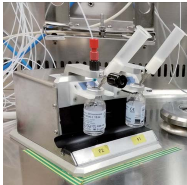
Figura 3. Vial di raccolta del ^{18}\text{F} all'interno della cella calda di manipolazione

di 75 mm. Quando al suo interno è presente una sorgente gamma di attività 3 Ci (111 GBq) l'intensità di dose alla pronta della cella è inferiore a 5 \mu\text{Sv/h} , mentre a 1 m è inferiore a 0.5 \mu\text{Sv/h} .