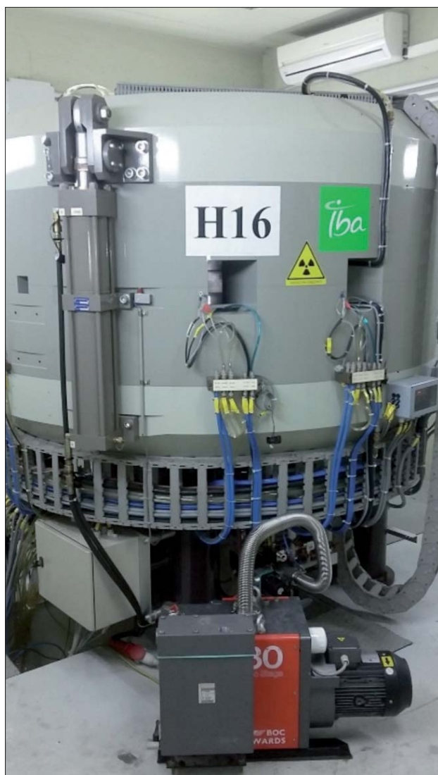
Figura 1. Il ciclotrone IBA "Cyclone® 18/9" installato presso il LENA

come parametro di progetto al massimo carico di lavoro della macchina una dose efficace annua all'operatore non superiore a 0.5 mSv. Questo porta, dopo opportuni calcoli di dimensionamento delle schermature (3), a dimensionare le pareti di calcestruzzo del bunker con uno spessore di 2.00 - 2.10 m, in grado di garantire un efficace schermo sia per il campo neutronico che per il campo gamma presente all'interno del bunker.