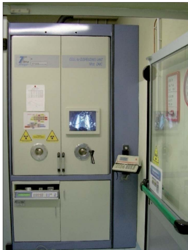
Figura 4. Cella calda di manipolazione

La fase più delicata da un punto di vista radioprotezionistico è il trasferimento della vial contenente fino a 5 Ci (185 Bq) di ^{18}\text{F} dalla cella calda al contenitore in piombo per il trasporto. I principali rischi per gli operatori sono: