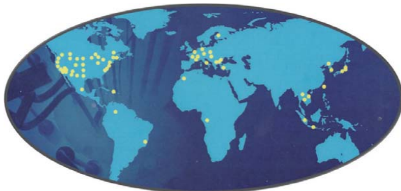
Figura 1. Mappa dei reattori di ricerca tipo TRIGA nel mondo (IAEA-GA)